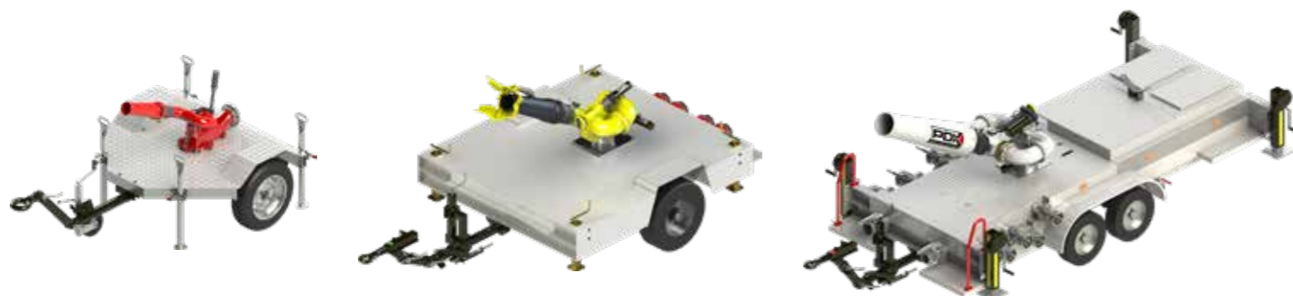
▶ «Delta» típusú váz Primator monitorral Trailer type "Delta" with Primator