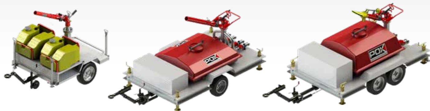
▶ Tréler típus: „2x150 L-es tartály” Primator monitorral Trailer type "Tank 2x150L" with Primator